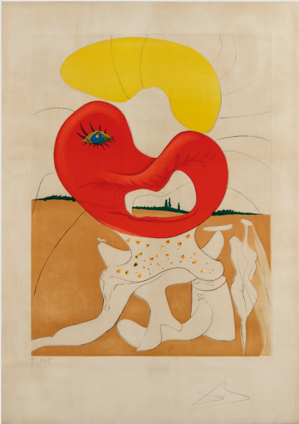
Salvador Dalí, La Sang du yin et du yang . Serie La conquête du cosmos (1974). Colección BBVA