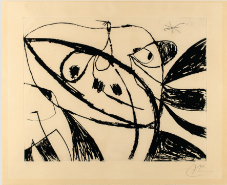
Joan Miró, Serie Mallorca III (Negro) , 6/10 (1973). Colección BBVA

The climax of this artistic movement came in 1938 with the International Exhibition of Surrealism in Paris, and its decline started immediately afterwards with the Second World War. In Spain, besides Miró and Dalí, leading figures included Remedios Varo, Maruja Mallo, Gregorio Prieto, Benjamín Palencia and Óscar Domínguez. Moreover, Spanish surrealists played an outstanding role in the cinema, not only thanks to Buñuel but also through the film sets designed by Dalí for Disney and Hitchcock.