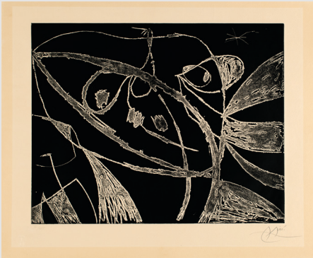
Joan Miró, Serie Mallorca III (Negativo) , VI/XXV (1973). Colección BBVA