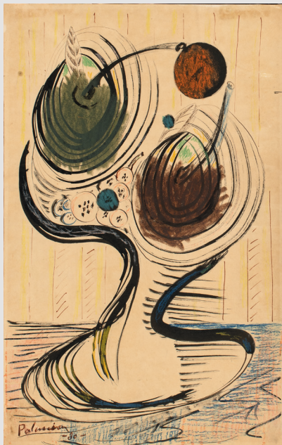
Benjamín Palencia, Bodegón (1930) Colección BBVA

Surrealism. Graphic work of the Colección BBVA Museum of Fine Arts of Valencia 21 March - 9 June 2024