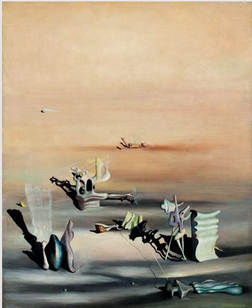
Yves Tanguy, La lumière de l'ombre (1939). Colección BBVA

El clímax d'este moviment artístic es va produir en 1938 amb l'Exposició Internacional del Surrealisme de París i la seua decadència va començar immediatament després amb la Segona Guerra Mundial. A Espanya, a més de Miró i Dalí, van ser destacats protagonistes Remedios Varo, Maruja Mallo, Gregorio Prieto, Benjamín Palencia o Óscar Domínguez. A més, el paper dels surrealistes espanyols en la cinematografia va ser molt destacat, no sols gràcies a Buñuel, sinó també a través de les escenografies dissenyades per Dalí per a Disney o Hitchcock.